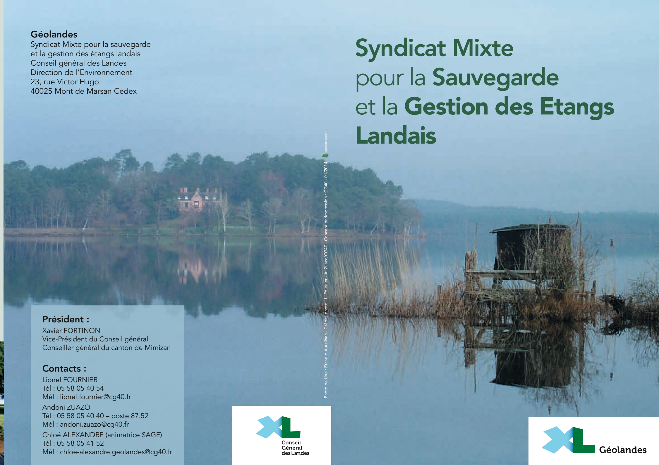
Photo de Une : Etang d'Aureilhan - Conception/Impression : CG40 - 01/2014