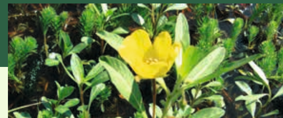
Jussie et Myriophylle du Brésil