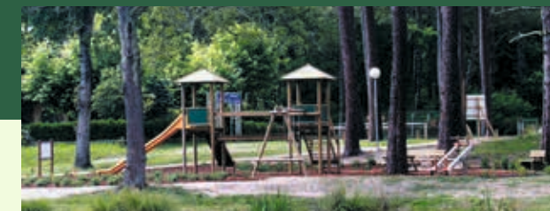
Aire de jeux à Mimizan