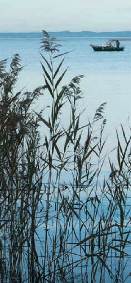
Lac de Cazaux-Sanguinet

Géolandes est un Syndicat Mixte créé en 1988 pour la sauvegarde et la gestion des étangs landais, couvrant ainsi 15 plans d'eau* douce du littoral landais, et représentant environ 10265 hectares de superficie en eau.