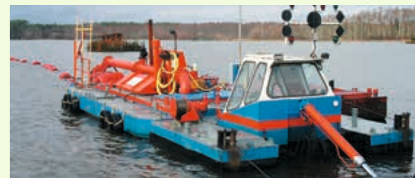
Dragage de l'étang d'Aureilhan

Pérenniser la surface en eau actuelle des lacs et étangs